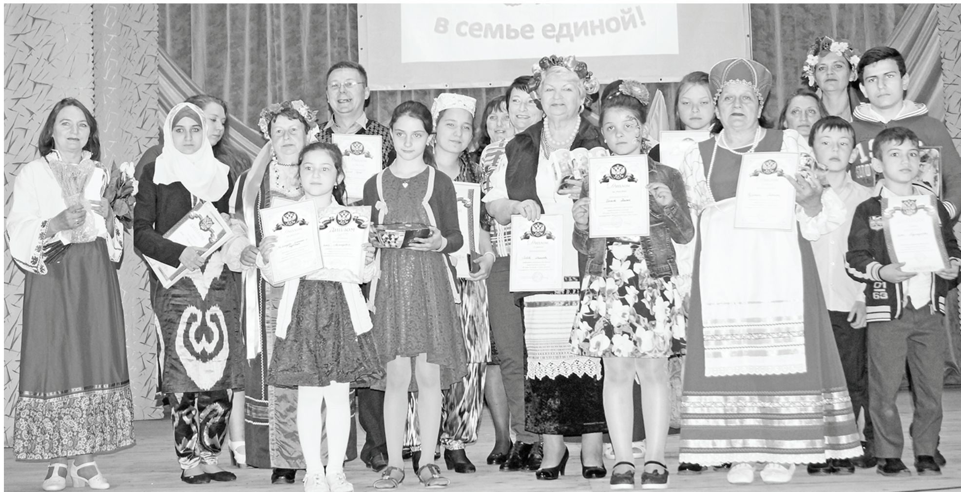
Победители и призеры.